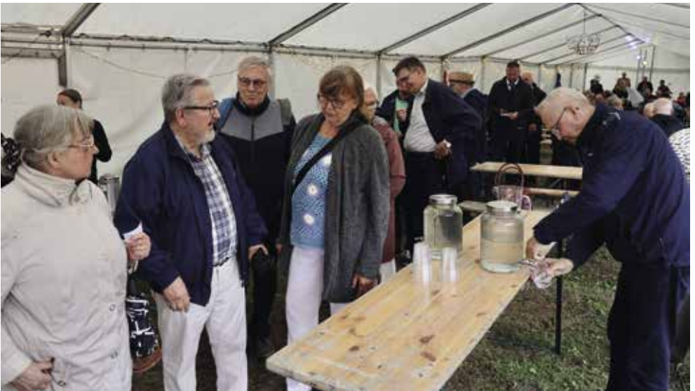
Kaksipäiväisten retkeilypäivien tilalle järjestettiin SWT:n jäsentapaaminen Valkeakosken musiikkitapahtuman yhteydessä. Tilaisuuteen osallistui satakunta vanhaa toveria, joista kaukaisimmat olivat matkustaneet paikalle Rovaniemeltä asti.